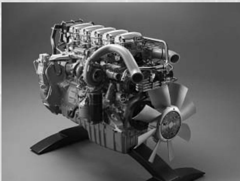
Ilustrační obrázek: Nový 9litrový motor Scania