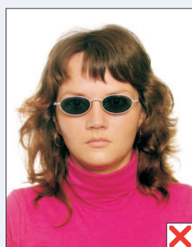
ráměčky překrývají oči