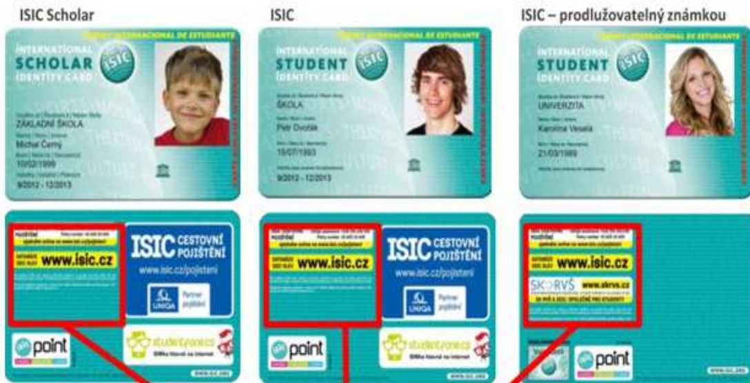
Samolepka relace pro Žákovské jízdné